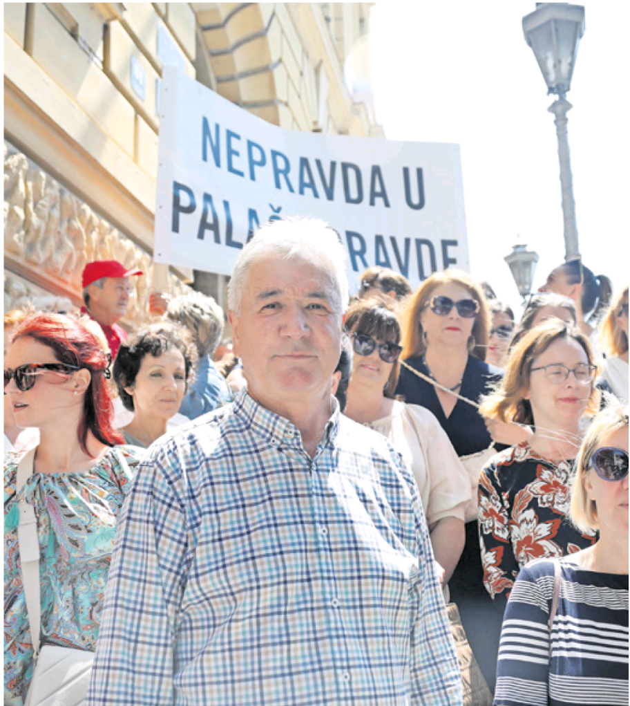
Zaposlenici na sudovima i tužiteljstvima ulaze u četvrti tjedan štrajka i najavljuju da će idući tjedan organizirati i veliki prosvjed ne dođe li do dogovora s Ministarstvom pravosuđa i uprave. No sudući prema izjavama ministra Malenice i stavu premijera Andreja Plenkovića, teško da će do dogovora doći

Pravosuđe u blokadi jer za nevidljivu vojsku – novca nema